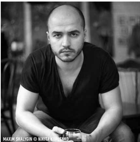
MAXIM SHALYGIN