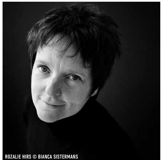
ROZALIE HIRS

Maxim Shalygin maakte in 2012 indruk met een 'symfonie' voor viool solo Letters to Anna , een gedurfd werk, reikend naar de spankracht van de beroemde Bach-Chaconne . Lullaby (première 13 maart 2009, Kiev) is een spiritueel crescendo voor strijkers. Bridge voor ensemble (2013) raakt aan de wereld van